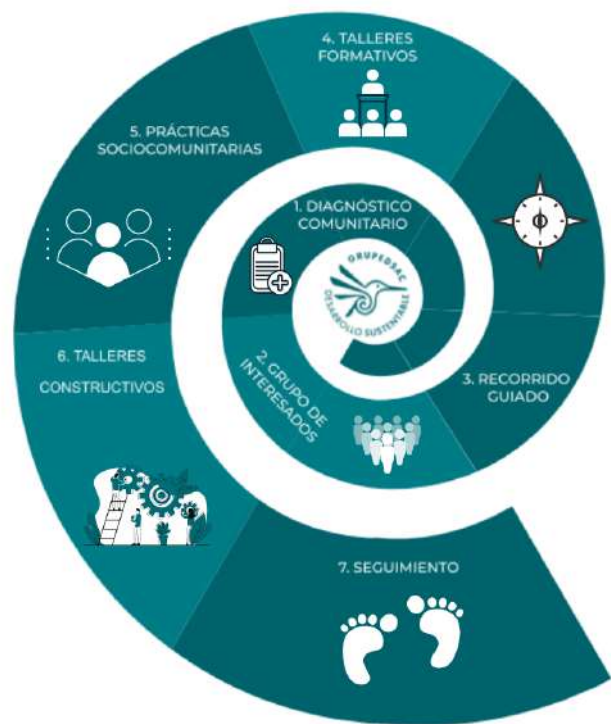
Diagrama 1. Ritual metodológico.

También es importante mencionar que se sigue el ritual metodológico (ver diagrama 1) de GRUPEDSAC. En donde el último paso, no es el final, sino es el inicio de algo nuevo, por lo tanto hay nuevos sentires y preocupaciones de las personas. Por ello se esquematiza en forma de espiral, el cual gira sin tener un fin.